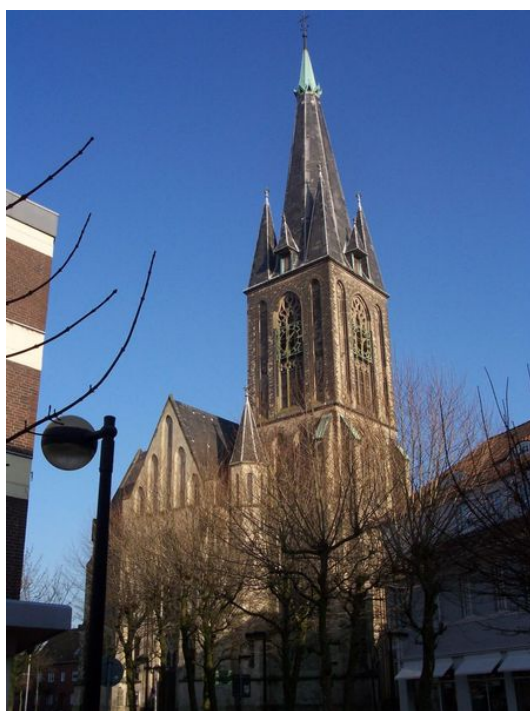
Bild 1. St. Pankratius in Gescher lange vor dem Konzert

Eingeleitet, nein, eingeläutet, wurde das Konzert durch das Vollgeläute von St. Pankratius a^1 - fis^1 - e^1 - d^1 - h^0 , das im ungebremsten Ausklingen selbst bereits aleatorische Glockenmusik ergab. Nachdem der letzte Schlag der h^0 verklungen war, meldete sich das Cambridge/Westminster-Uhrschlag-Schlagwerk mit seinem h^2 - a^2 - g^2 - d^1 , beschlossen vom Stundenschlag, der Glocke d^1 . Dies verwies schon auf das nachfolgende Einspielstück, die Einleitung zur Bach-Kantate BWV 29 in D-Dur – eigentlich hätte die Glocke hierzu als „Glockensaum“ (statt „Orgelpunkt“) einfach weiter läuten können. Doch zunächst begrüßte der Ortsgeistliche Kaplan Tomalla die Zuhörer und den Organisten 1 mit einer kurzen Ansprache.