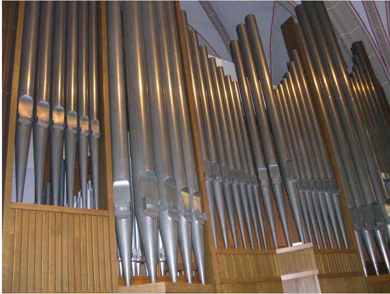
Bild 2. Stockmann-Orgel von 2004 in St. Pankratius zu Gescher (Hauptwerk, Schwellwerk, Pedalwerk); Rückpositiv nicht abgebildet. Neue Aufnahme von unten!

Der Auszug aus der Ratswahlkantate Johann Sebastian Bachs (BWV 29) sollte das Konzert eröffnen. Dieses Stück in herrschaftlich-feierlichem D-Dur drückt einen großen Jubel aus: die Freude über den Wechsel der Obrigkeit – ein Sachverhalt, der nicht ganz ohne Anspielung auf das Hier und Jetzt des jüngst translozierten DEUTSCHEN GLOCKENMUSEUMS zu sehen ist. Dieses Stück ist wie ein manuell entfesselt Cembalostück – nein, Violinstück. Denn es ist eine Transkription zweiten Grades, worauf der